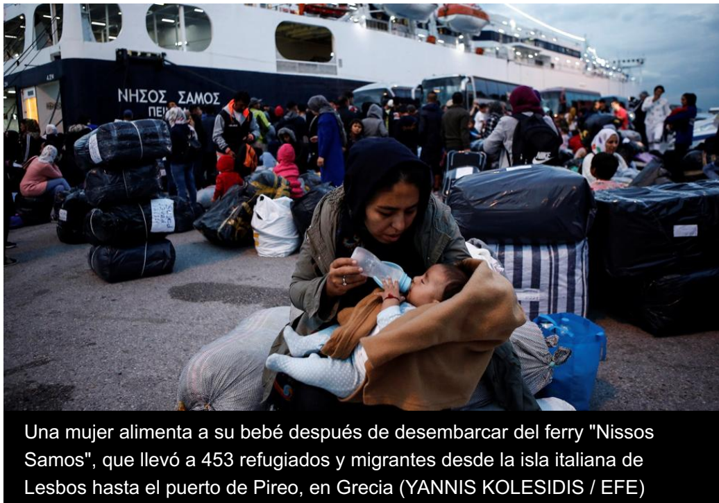
Una mujer alimenta a su bebé después de desembarcar del ferry "Nissos Samos", que llevó a 453 refugiados y migrantes desde la isla italiana de Lesbos hasta el puerto de Pireo, en Grecia

La Organización Internacional para las Migraciones reafirma que es la ruta más peligrosa del mundo